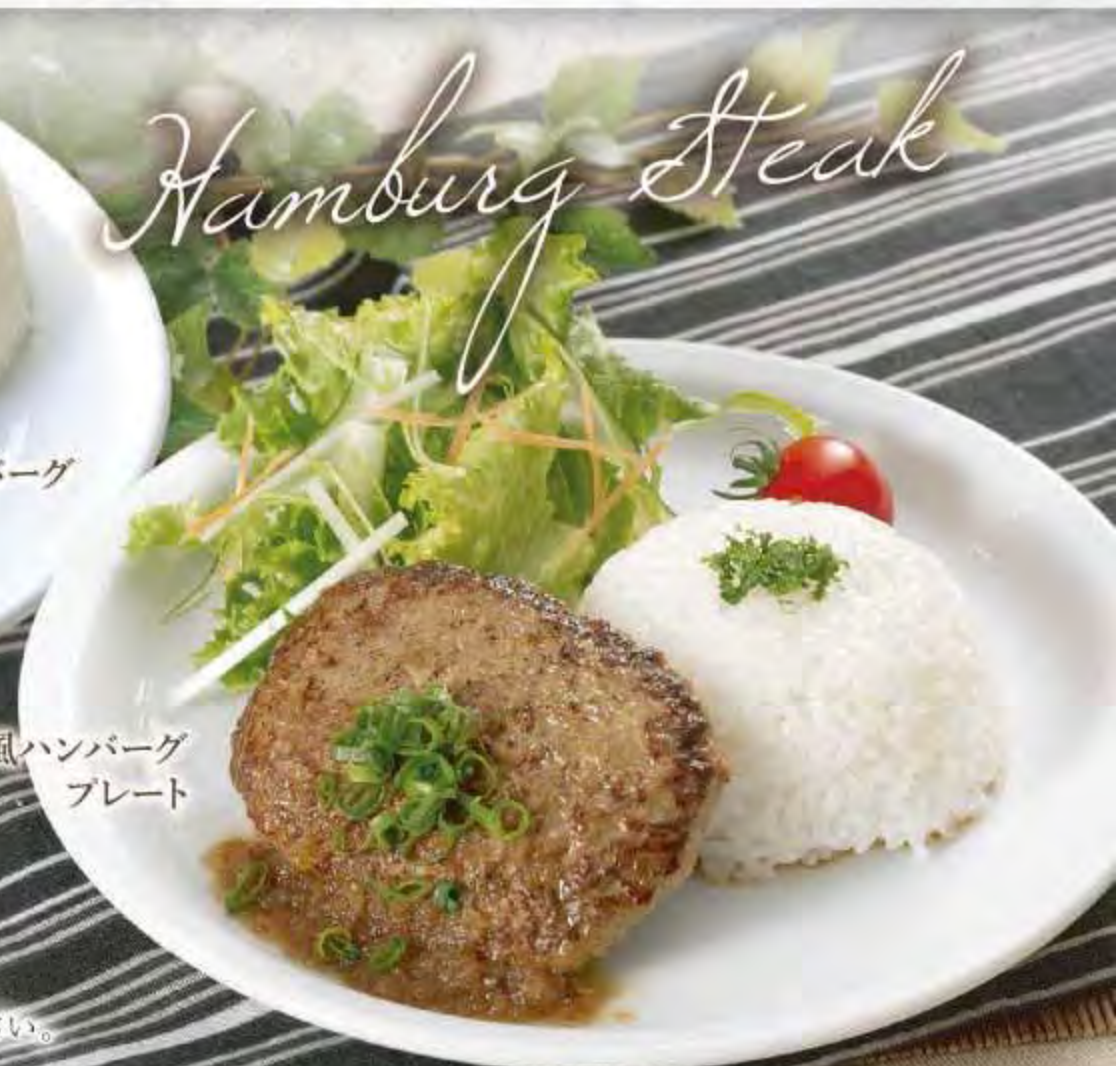
和風ハンバーグプレート

※掲載の写真はイメージです。実際とは異なる場合がございますので予めご了承下さい。 ※表示価格は税込です。※お米の産地情報についてはフロントまでお尋ねください。