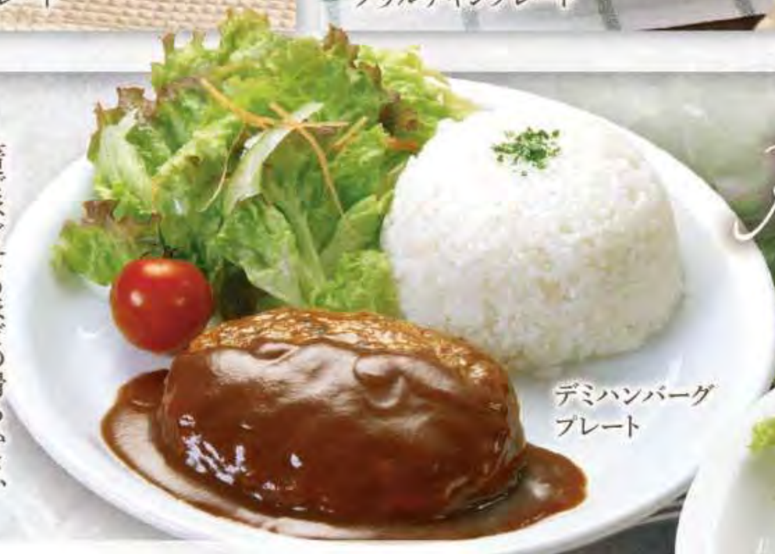
デミハンバーグプレート

箸でほぐせるほどの滑らかさ、柔らかさが自慢です。カットした時に溢れる肉汁が美味しさを醸し出す、当店オススメのハンバーグです。