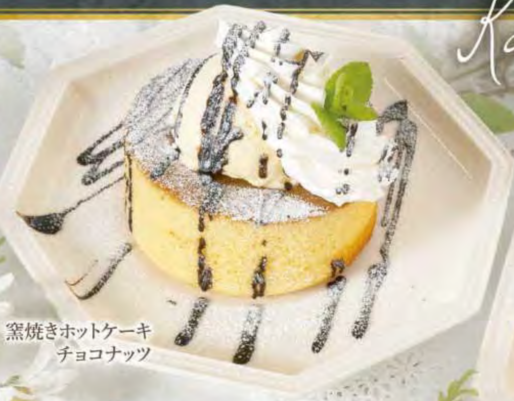
窯焼きホットケーキ チョコナッツ

窯(オープン)でじっくりと焼き上げたふんわり、しっとり食感の厚焼きホットケーキです。