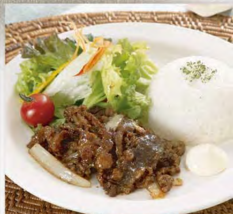
スタミナ焼肉プレート

箸でほぐせるほどの滑らかさ、柔らかさが自慢です。カットした時に溢れる肉汁が美味しさを醸し出す、当店オススメのハンバーグです。