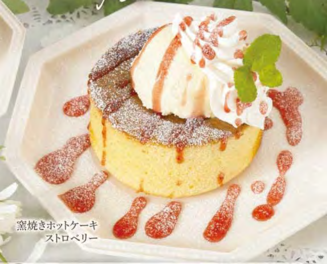
窯焼きホットケーキ ストロベリー