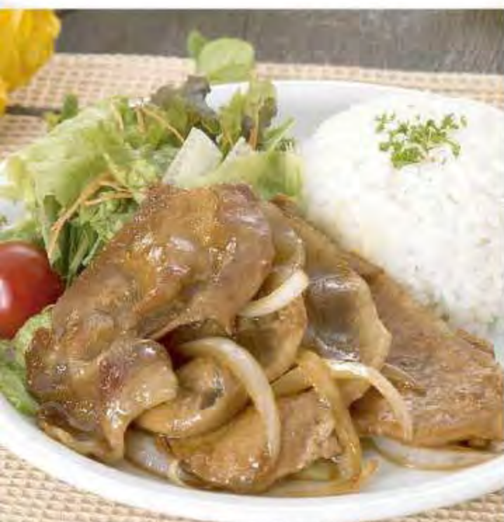
豚の生姜焼きプレート