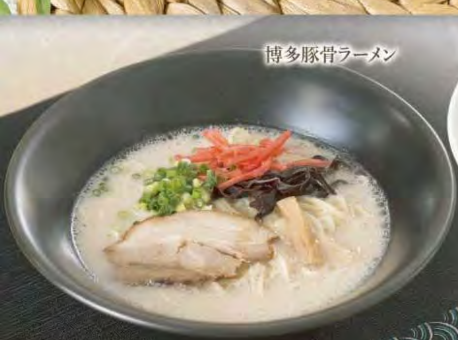
博多豚骨ラーメン

香り豊かなそばを、 こだわりのかつお節を 加えてとった特製つゆに つけてお召し上がり下さい。