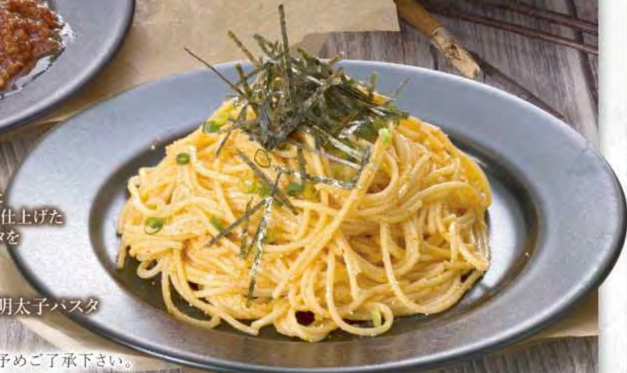
和風明太子パスタ

※掲載の写真はイメージです。実際とは異なる場合がございますので予めご了承下さい。 ※表示価格は税込です。※お米の産地情報についてはフロントまでお尋ねください。