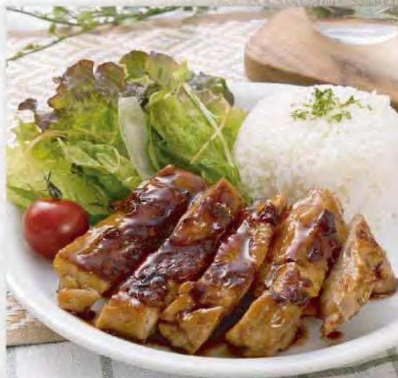
グリルチキンプレート